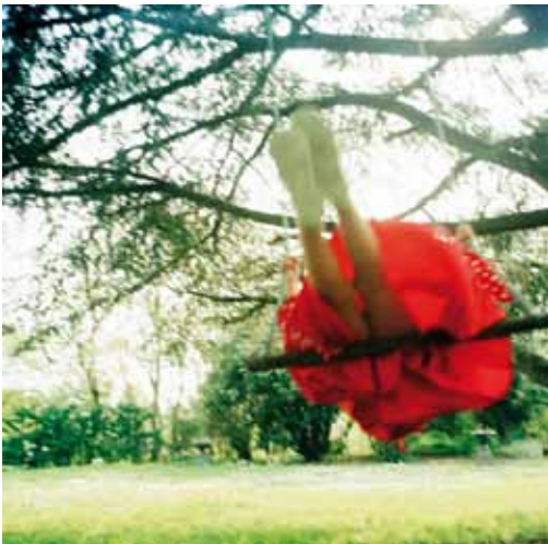
© Pascaline Marre, Le coquelicot courtesy Galerie Binôme