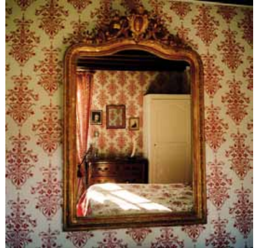
© Pascaline Marre, La chambre rouge , courtesy Galerie Binôme