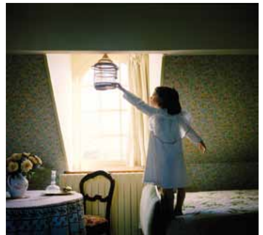
© Pascaline Marre, La cage , courtesy Galerie Binôme

tirage jet d'encre pigmentaire sur papier Hahnemühle / format 50x50 cm & 75x75 cm