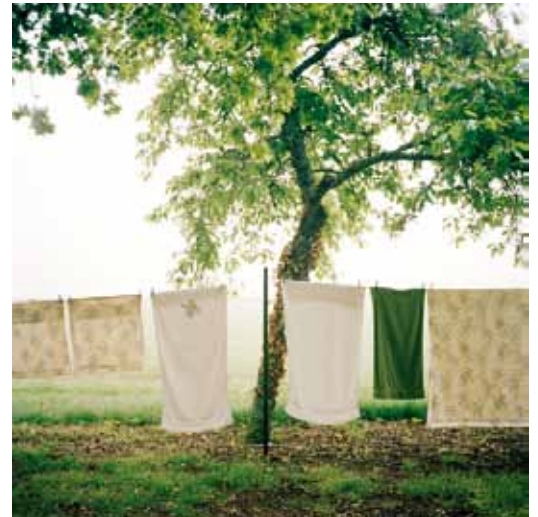
© Pascaline Marre, Le fil courtesy Galerie Binôme