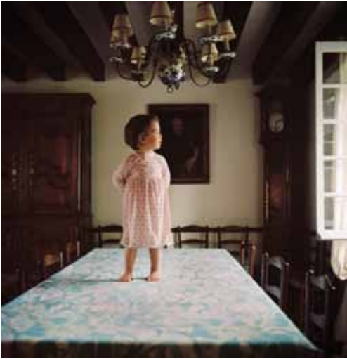
La table