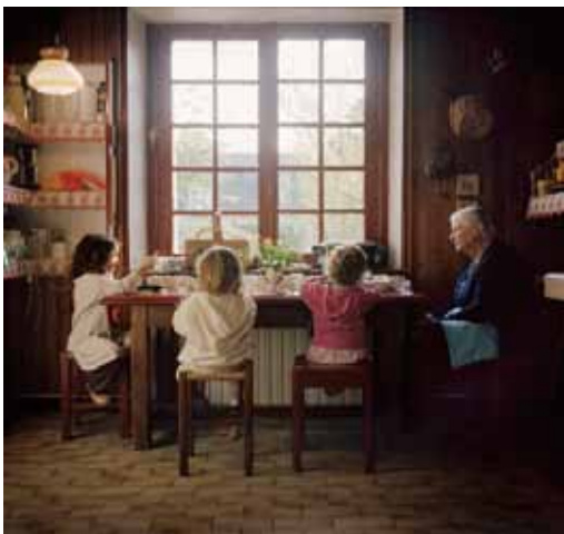
© Pascaline Marre, Le dîner courtesy Galerie Binôme